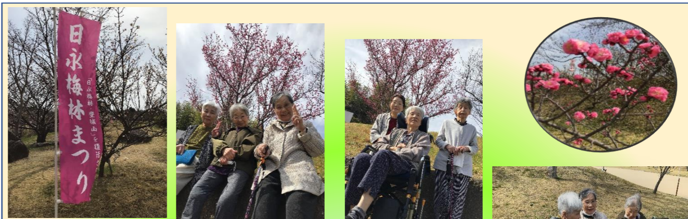
梅を見に 南部丘陵公園へ行ってきました