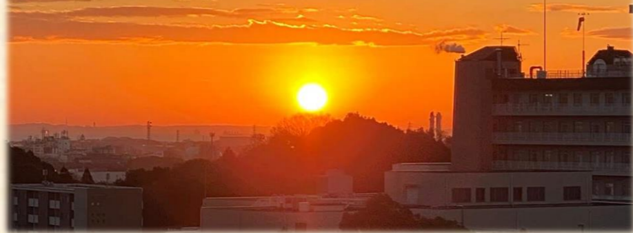
ケアヒルズ四日市2階からの初日の出