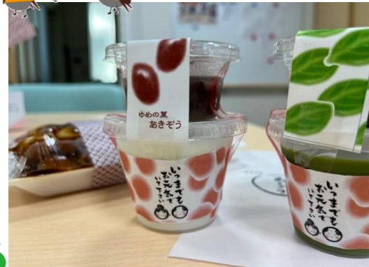
敬老の日を皆さんで祝いました。