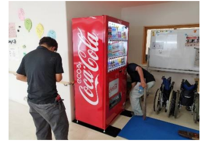
自動販売機を更新しました。