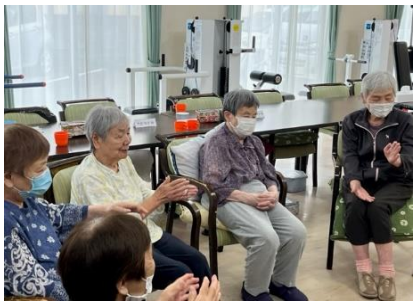
来月もお楽しみに！！